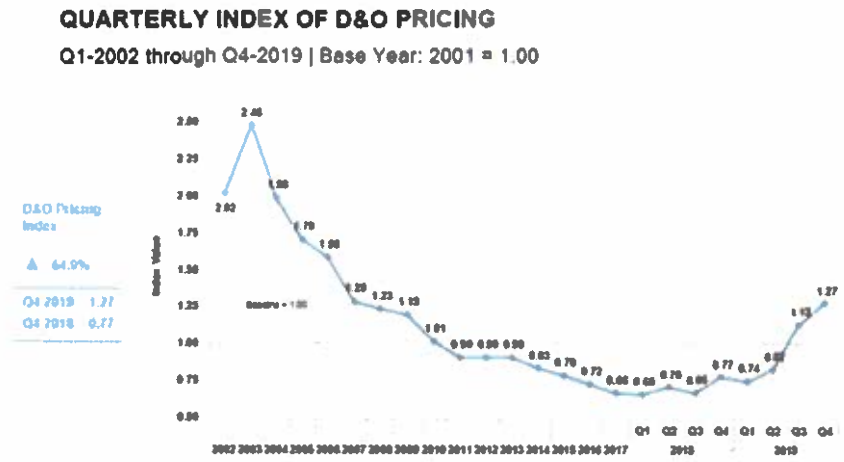
Figura 1: Índice de precios programas D&O (Cuatrimestral)

Observamos en la Figura 1 que estos incrementos aún no han tocado techo. Según el informe "Pricing Index" elaborado por Aon Plc en el 2019, el incremento de tasas se mantuvo a lo largo del año. La reciente publicación del mismo índice para el Q1 2020 resalta que los clientes que renovaron sus pólizas en dicho periodo han visto incrementadas sus tasas en un 82.9% respecto al año anterior. A pesar de ello, un 94.2% renovaron con su mismo asegurador, lo que pone de manifiesto que las alternativas de mercado se sitúan en la misma línea o con mayores restricciones.